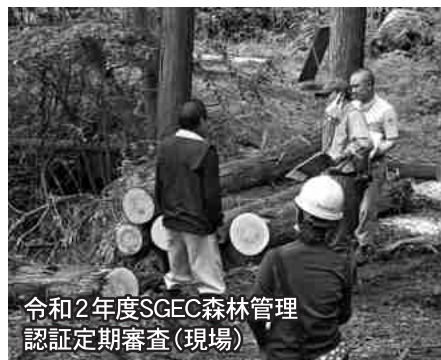
令和2年度SGEC森林管理認定定期審査(現場)