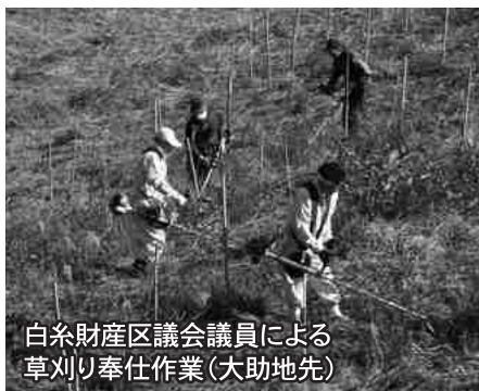
白糸財産区議会議員による草刈り奉仕作業(大助地先)