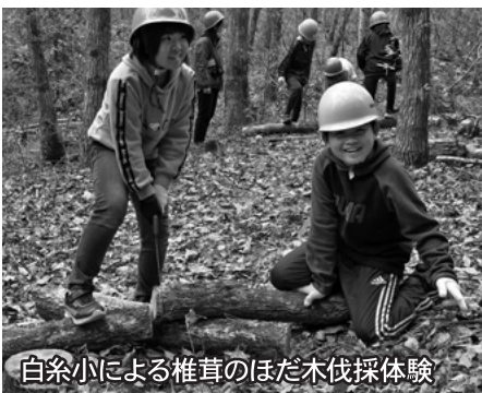
白糸小による椎茸のほた木伐採体験