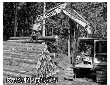
内野分収林間伐状況