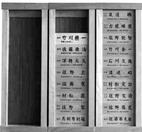
歴代白糸財産区議長・所長