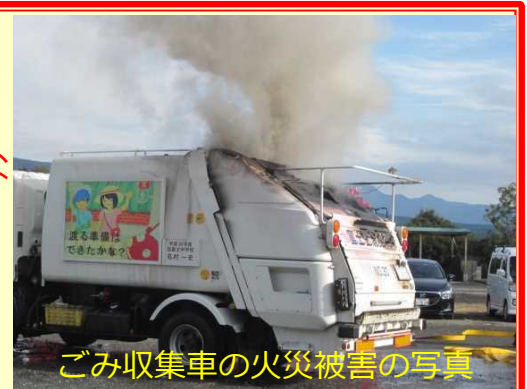
ごみ収集車の火災被害の写真

電子たばこ、モバイルバッテリー、ハンディ扇風機などのリチウムイオン電池使用製品は、ごみ収集車やごみ処理施設等での 火災 の原因となるので、 絶対にごみ集積所には出さない でください!!