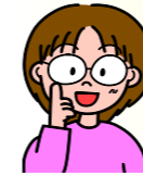
地域包括支援センター