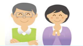
家族に認知症を抱える方