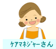
ケアマネジャーさん