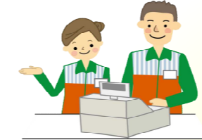
ご近所のお店屋さん