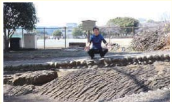
6 大宮縄状溶岩 市指定天然記念物 溶岩が冷えて収縮する際、縄のような形になったもの