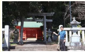
5 若之宮浅間神社 木花之佐久夜毘売命の第一王子を祀る