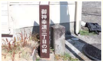
7 御神幸道三丁目の碑 浅間大社から1丁(約109m)毎に山宮浅間神社までの御神幸道に置かれる「丁目石」