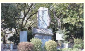
15 駿州赤心隊の碑 江戸時代末期、富士亦八郎重本が隊長となり官軍の東征への参加のために結成