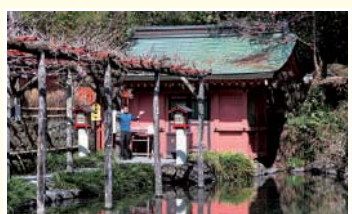
14 水屋神社 湧水を司る神として、湧き水の水源の岩の上に祀られる神社