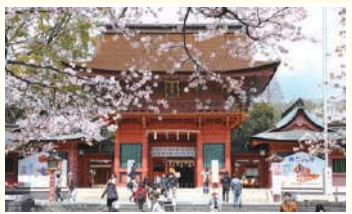
11 楼門 県指定文化財 高さ約12m。左右には隨身像が安置されている