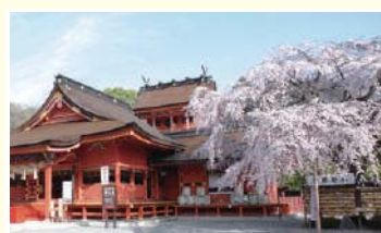
13 信玄桜 武田信玄が、しだれ桜を手植えし奉納したとされる