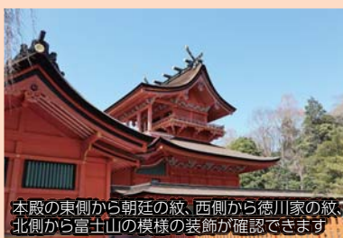
本殿の東側から朝廷の紋、西側から徳川家の紋、北側から富士山の模様の装飾が確認できます