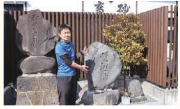
2 富士亦八郎重本筆跡の道祖神 幕末の浅間大社大宮司「富士亦八郎重本」が記した文字道祖神