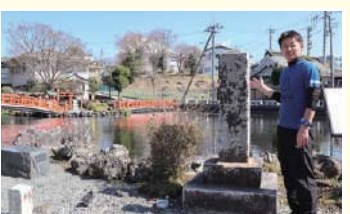
16 御神幸道首標の碑 元禄4(1691)年立石。山宮浅間神社までの御神幸道の起点とされる