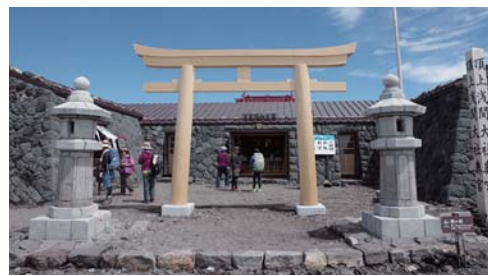
▲明治34年、奥宮では寺の建物が取り壊され、新しく本殿が建てられました