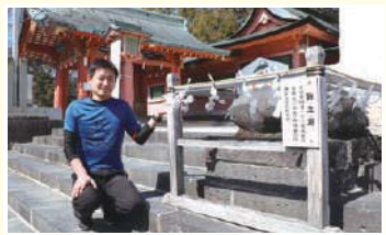
10 鉾立石 山宮御神幸の際、神の宿る鉾を立てて休めた石