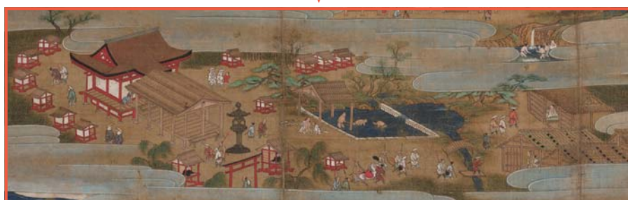
▲左側に浅間大社、中央に湧玉池、右側に宿坊が描かれています