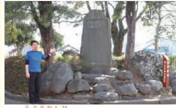
1 芙蓉館碑 富士氏*の居館「芙蓉館」があった場所

語句の説明 ※ 富士氏 現在の富士宮市一帯を支配していた氏族。代々、浅間大社の大宮司(神社の神職の長)を継承していた。