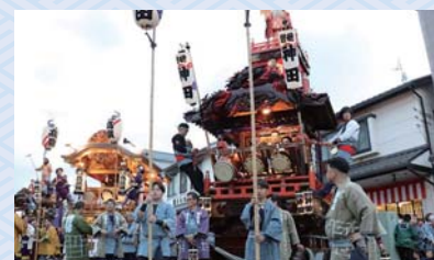
▲氏子町内では、山車をひき回し例祭を祝います

今も4月の初申祭では、浅間大社と山宮浅間神社を参拝して豊かな実りを祈り、11月の例祭では、実りの秋に感謝しています。