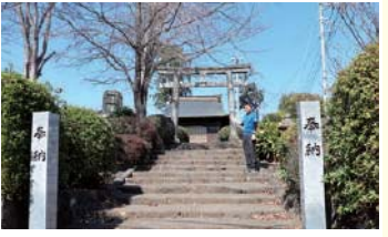
4 二之宮浅間神社 木花之佐久夜毘売命の第二王子を祀る