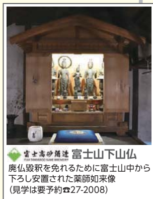
富士高砂街道 富士山下山仏 廃仏毀釈を免れるために富士山中から下ろし安置された薬師如来像 (見学は要予約 ☎27-2008)