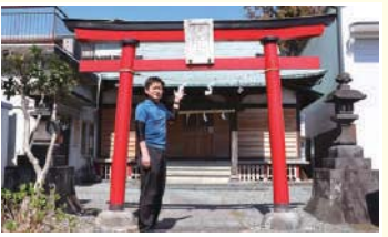
8 蔵屋敷稲荷 富士氏*が、拠点とした大宮城の蔵屋敷に祀られていた稲荷社といわれる