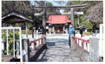
3 富知神社 富士山を祀る神社で、もとは浅間大社の場所にあった