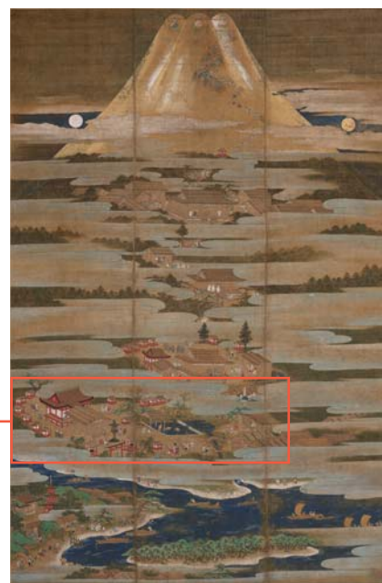
▲国指定重要文化財に指定されている「絹本著色富士曼荼羅図」(富士山本宮浅間大社蔵)

室町時代に描かれたとされる「絹本著色富士曼荼羅図」には、浅間大社を参拝した人々が、湧玉池で心身を清め、富士山へ向かう様子が描かれています。