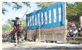
9 桜の馬場 源頼朝が、奉納したことに由来する流鏝馬祭が毎年5月に行われる