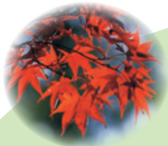
木・かえで (昭和 44 年 5 月 5 日制定)