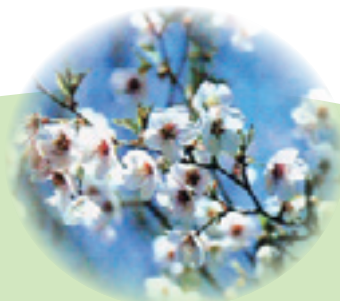
花・ふじざくら (昭和 44 年 5 月 5 日制定)