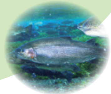
魚・にじます (平成 21 年 6 月 1 日制定)