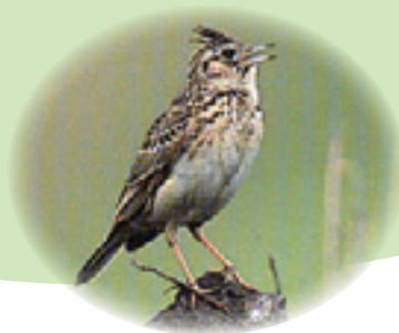
鳥・ひばり (昭和 44 年 5 月 5 日制定)