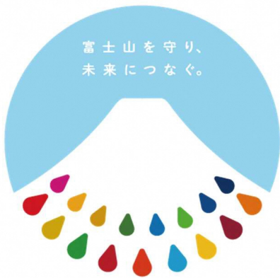
SDGs 未来都市・富士宮市 富士山SDGs

そこで、各国の代表が集まり、世界共通の目標を立てて、問題を解決しようと生まれたのがSDGsなのです。