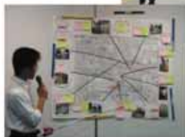
まち歩き後の発表