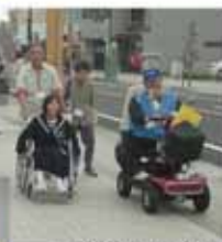
車いすを利用した体験