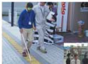
アイマスクを利用した視覚障がい者体験

この中で「人にやさしいまちづくり推進計画策定地域まちづくり部会」のメンバーによって行われた、まち歩きを行い、実際に重点整備地区内を歩いていただき、まちに存在する問題点を挙げていただきました。