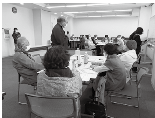
▲グループ発表の様子