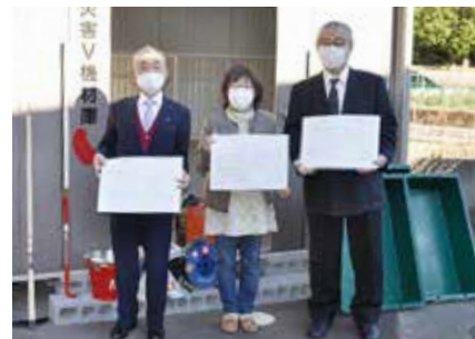
▲赤い羽根共同募金助成事業 災害ボランティア活動用機器に関する 覚書締結

赤い羽根共同募金にご協力いただいた皆様の温かい気持ちに感謝します。ありがとうございました。