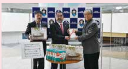
▲富士宮ライオンズクラブ様 / ライトニング様