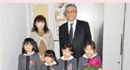
▲富士宮聖母幼稚園様