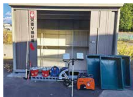
▲災害ボランティア活動用機器