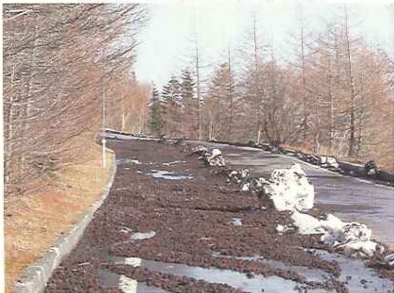
⑤ 道路への土砂流出状況(4/6撮影)