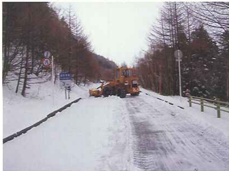
⑦ 4月の降雪および除雪作業状況(4/16撮影)