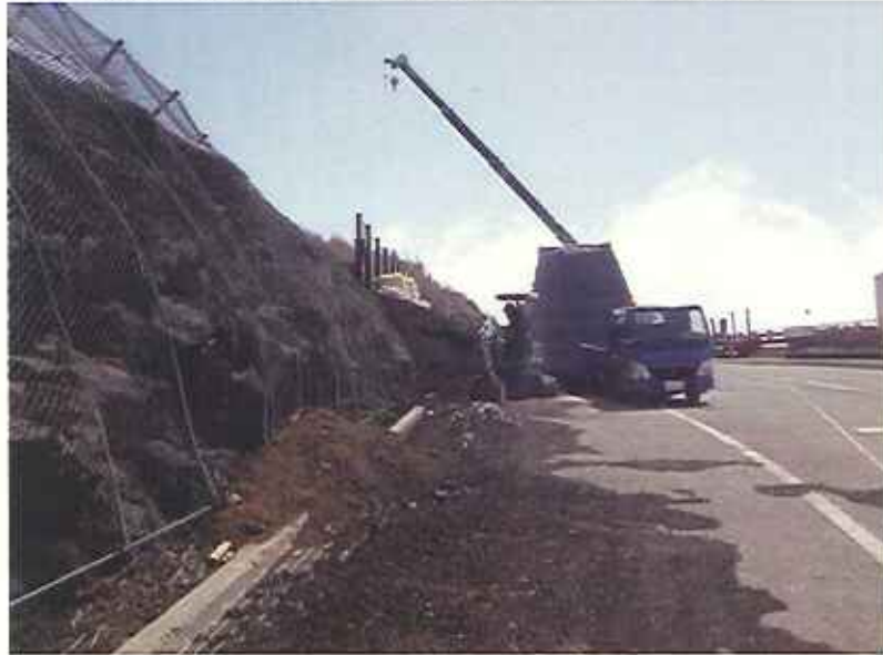
①落石防護柵西側土砂流出状況(4/14撮影)