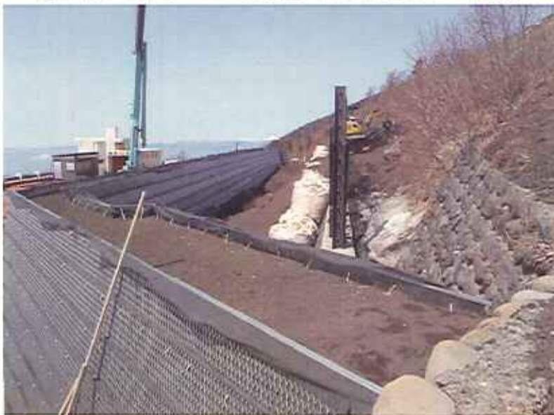
③土堤工背後への土砂流出・堆積状況(4/14撮影)