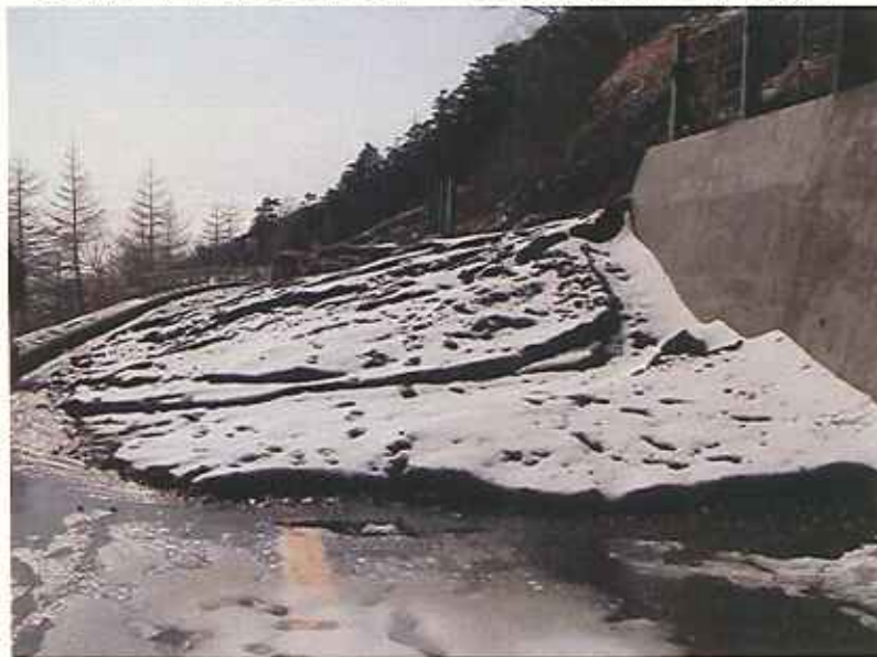
⑥ 新五合目付近の道路への土砂流出状況(4/6撮影)