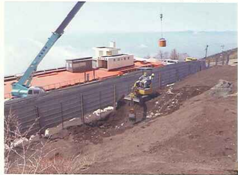
②落石防護柵背面への土砂堆積状況(4/14撮影)