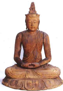
Buddhist statue from Murayama