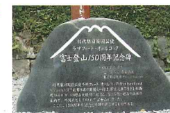
Alcock Monument 올콕 기념비 阿礼国纪念碑

In 1860, Sir Rutherford Alcock, the British Consul-General to Japan, was the first Westerner to climb Mt. Fuji. Details of his climb, which took the Omiya-Murayama Ascending Route, are described in his The Capital of the Tycoon .