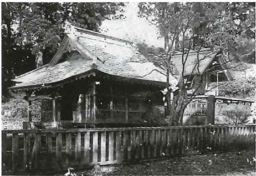
Sengen-jinja Shrine Hall at the start of the 20th century

根据1868年当时的政府所颁发的神佛分离令, 兴法寺被废除, 分成村山浅间大社和大日堂, 但直到如今, 两所设施依然并存, 保留着神佛调和的形态。