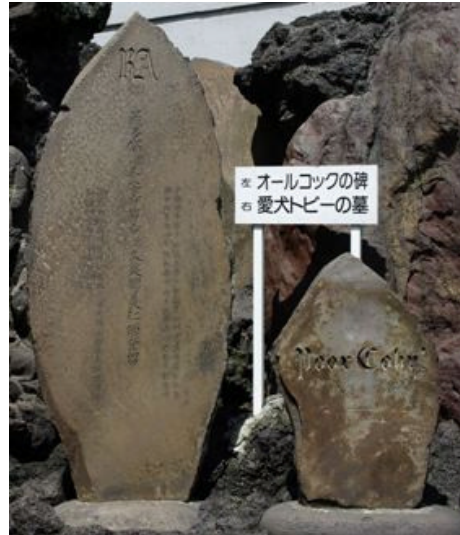
オールコック滞在記念碑(左)とトビーの碑(右)

滞在中、オールコックは愛犬トビー(Toby)を亡くすという大事件に遭った。トビーは住民達に手厚く弔われ、その親切さはオールコックをいたく感激させた。江戸に戻った後、彼は「POOR TOBY」と刻んだ墓石を熱海に送り、愛犬の墓に建ててもらった。現在この墓石は、大湯間欠泉のそばに、オールコック滞在記念碑と並んで建っている。